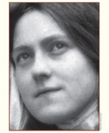
Exposition de Photographies Exhibition of Photographs