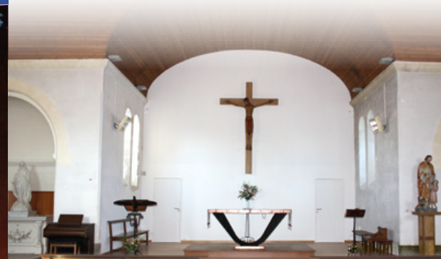
Chœur en cours de rénovation