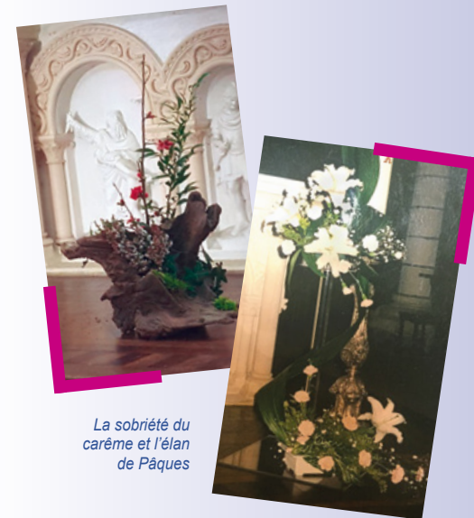
La sobriété du carême et l'élan de Pâques

Forme et volume, couleur et mouvement, symbole et prière, en lien avec les textes du jour, répondent à des principes précis.